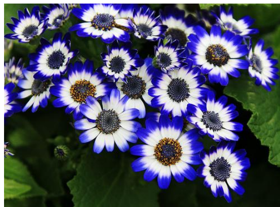
شکل ۴- گل سینره هیبرید گل درشت (لب آبی)