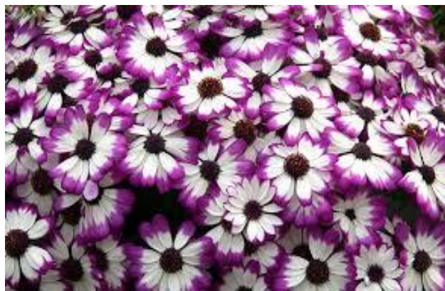
شکل ۶- گل سینه هیبرید (لب صورتی)

این گیاه به خاک حاصلخیز و سبک با زهکشی مناسب نیاز دارد. برای این منظور دو سوم حجمی خاک حاصلخیز و سبک باغچه با یک سوم خاک برگ کاملاً پوسیده مخلوط می شود. بهتر است خاک مرطوب باشد و آبیاری باید از پایین صورت گیرد. به دلیل دوره سرمایی که این گیاه طی می کند، کود نیتروژنه با نترات بالا توصیه می شود. از آنجا که شرایط محیطی بیشتر منازل گرم و خشک است، طول عمر سینه پس از خارج شدن از گلخانه اغلب کوتاه است. پس از پایان دوره گلدهی نیازی به تعویض گلدان نبوده و گیاه دور انداخته می شود چون فقط برای یکبار گلدهی دارد. چنانچه این گیاه در دمای کمتر از ۱۳ درجه سانتی گراد، رطوبت بالا و محل آفتابی نگهداری شود مدت زمان بیشتری عمر خواهد کرد.