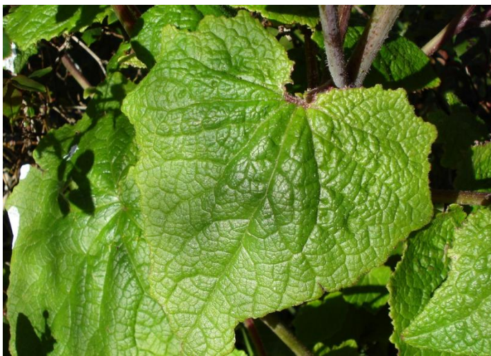
شکل ۱- تصویر برگ گل سینره

گیاهی علفی، متراکم، گلدار و زینتی مناسب برای آپارتمان، گلخانه و یا اتاق آفتابگیر در فصل بهار است. این گیاه دورگه ای بین دو گونه P. heritieri و P. cruentus می باشد. سینره شب عید وارد بازار می شود و دارای برگ های بزرگ قلبی به رنگ سبز چمنی یا تیره با لبه دندانه دار است که به صورت طوقه ای قرار داشته و پشت آنها ارغوانی یا آبی رنگ و می باشد.