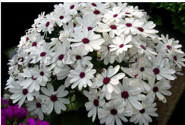
شکل ۵- سینره پاکوتاه و پرگل (سفید)

ماه‌های گرم سال گل نمی‌دهد. گل‌های پلاسیده را باید جدا نمود تا عمر بقیه گل‌ها زیاد شود چون با تولید گاز اتیلن فرایند پیری را در گل‌های باقی مانده تسریع می‌بخشند.