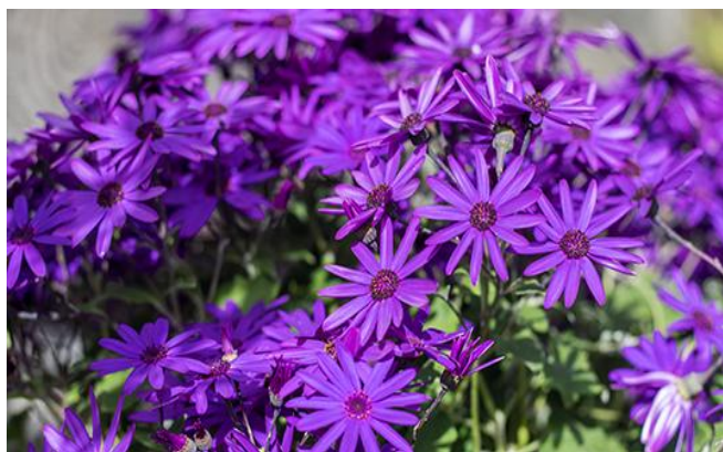
شکل ۷- گل سینه ستاره ای