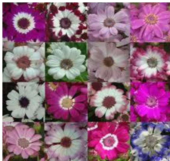
شکل ۲ و ۳- تصاویر گل های رنگارنگ