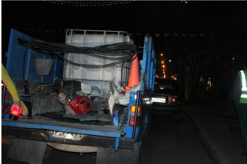
مخزن ۱۰۰۰ لیتری و موتور سمپاش