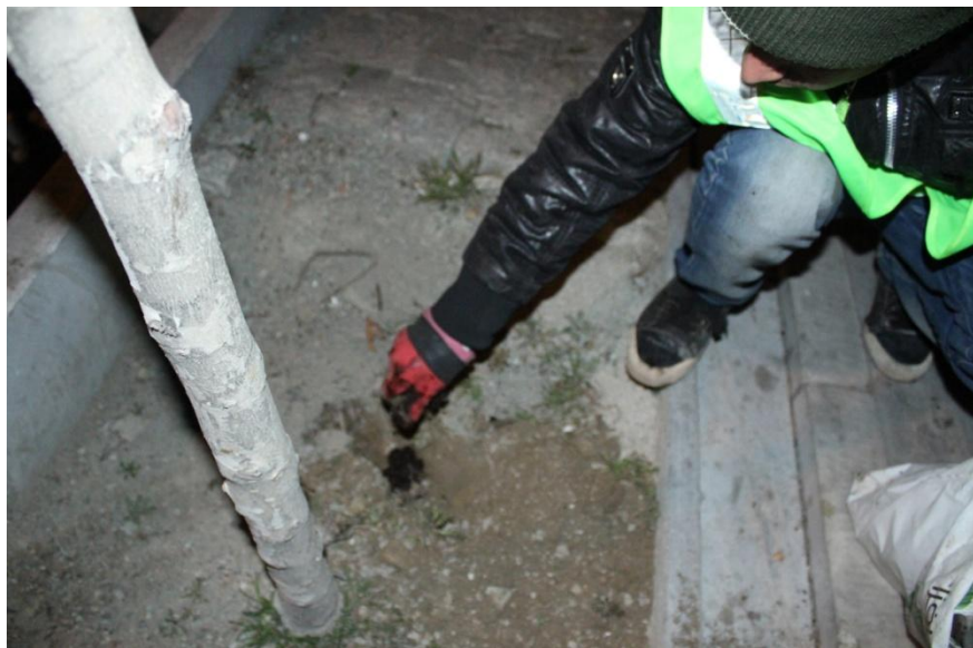
درختان فاقد لوله تغذیه

بعلت حل نشدن کود viva در آب، این نوع کود بصورت دستی و حدود ۱۰۰ گرم برای هر اصله در نظر گرفته شد