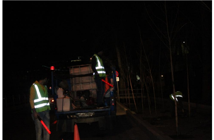
رعایت نکات ترافیکی در خیابان ولی عصر (عج)